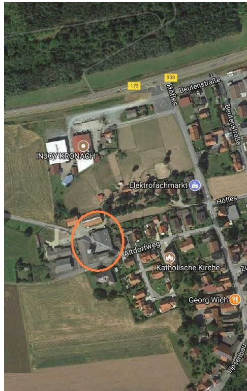
Foto vom Ort