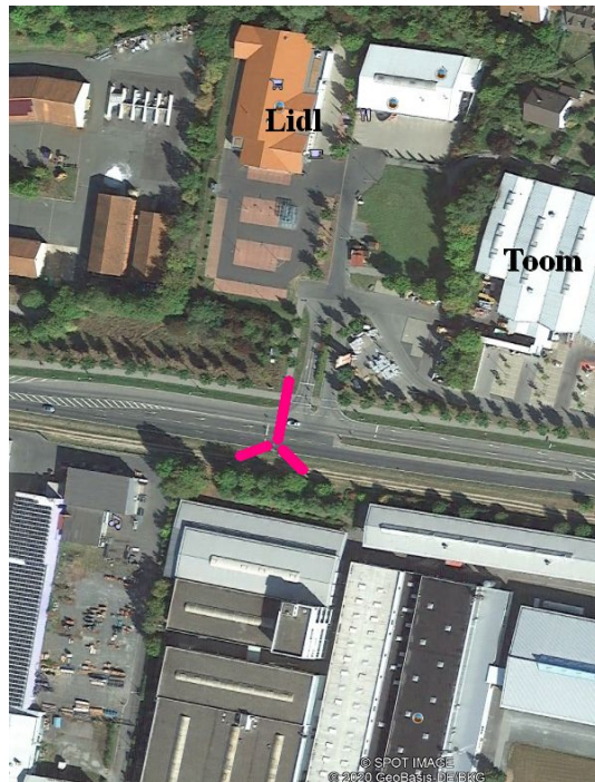
Foto vom Ort